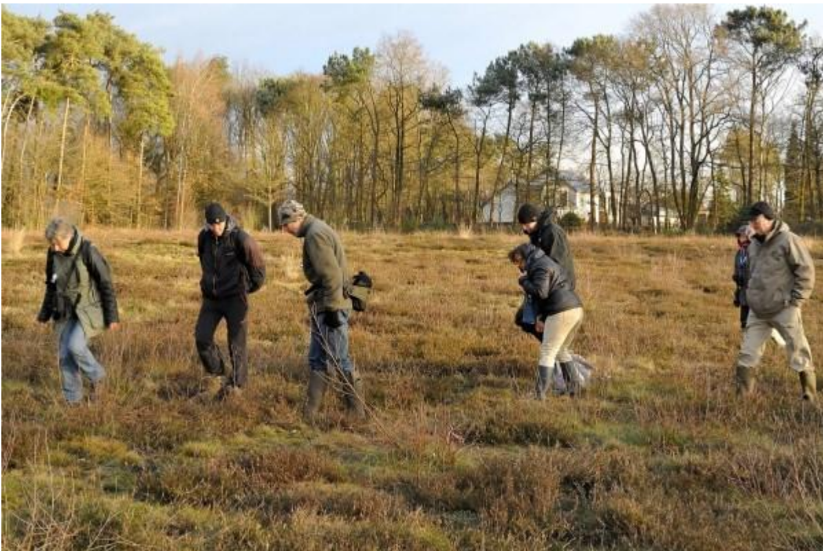
Kraag omhoog en handen in de zakken was geen luxe maar speuren deden ze.