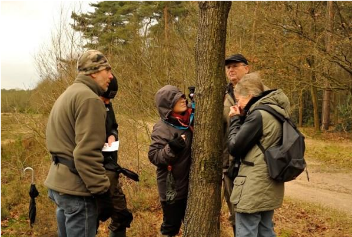
Bij de eerste boom hadden we al moeite om er voorbij te raken!