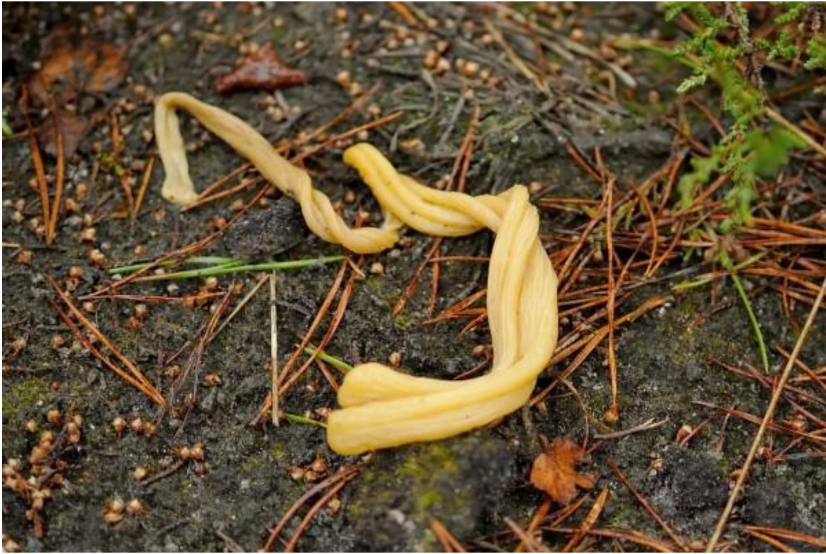
Heideknotschwammen in alle maten