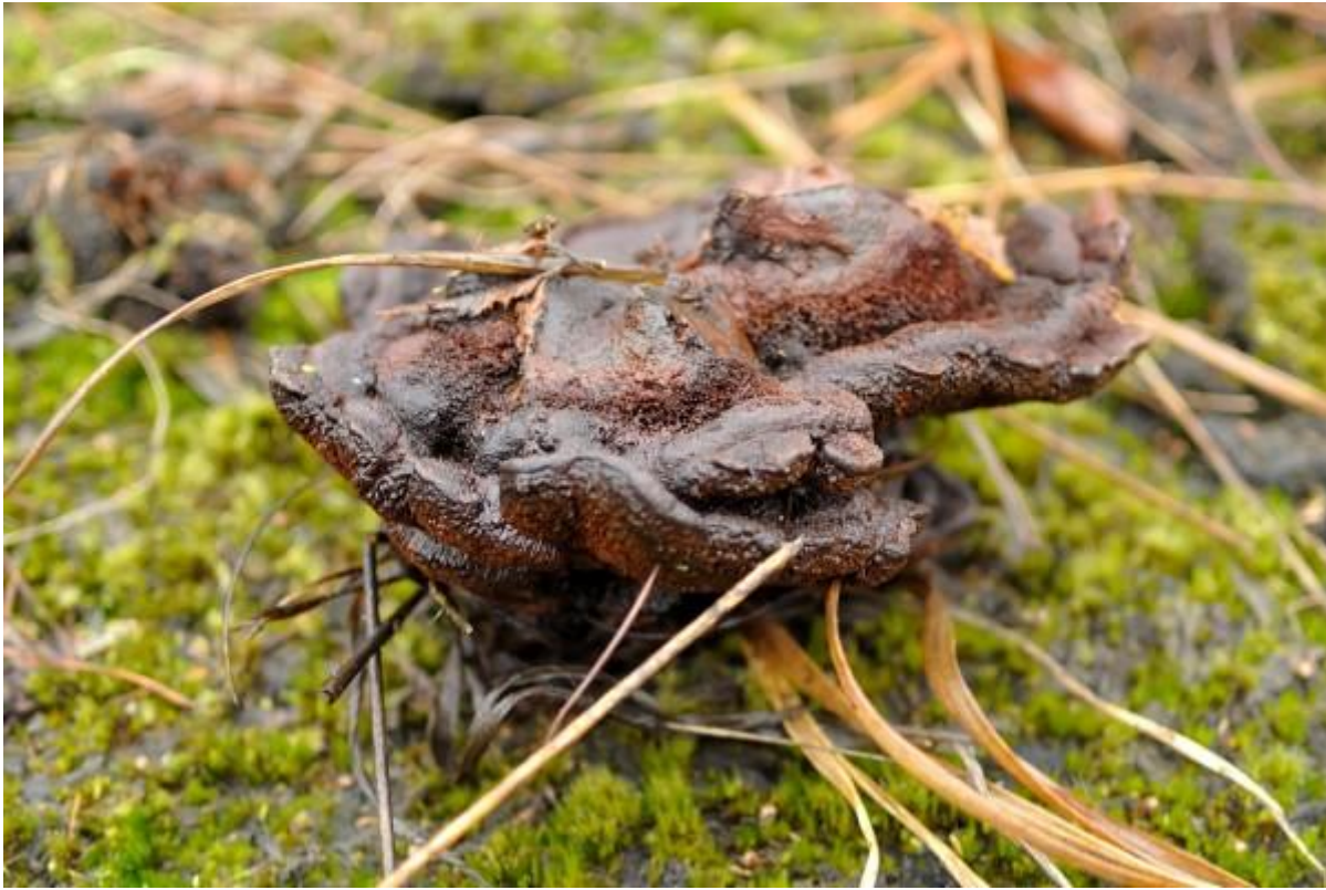
Een toefige labrynthzwam. Moet met zo een naam door het leven!