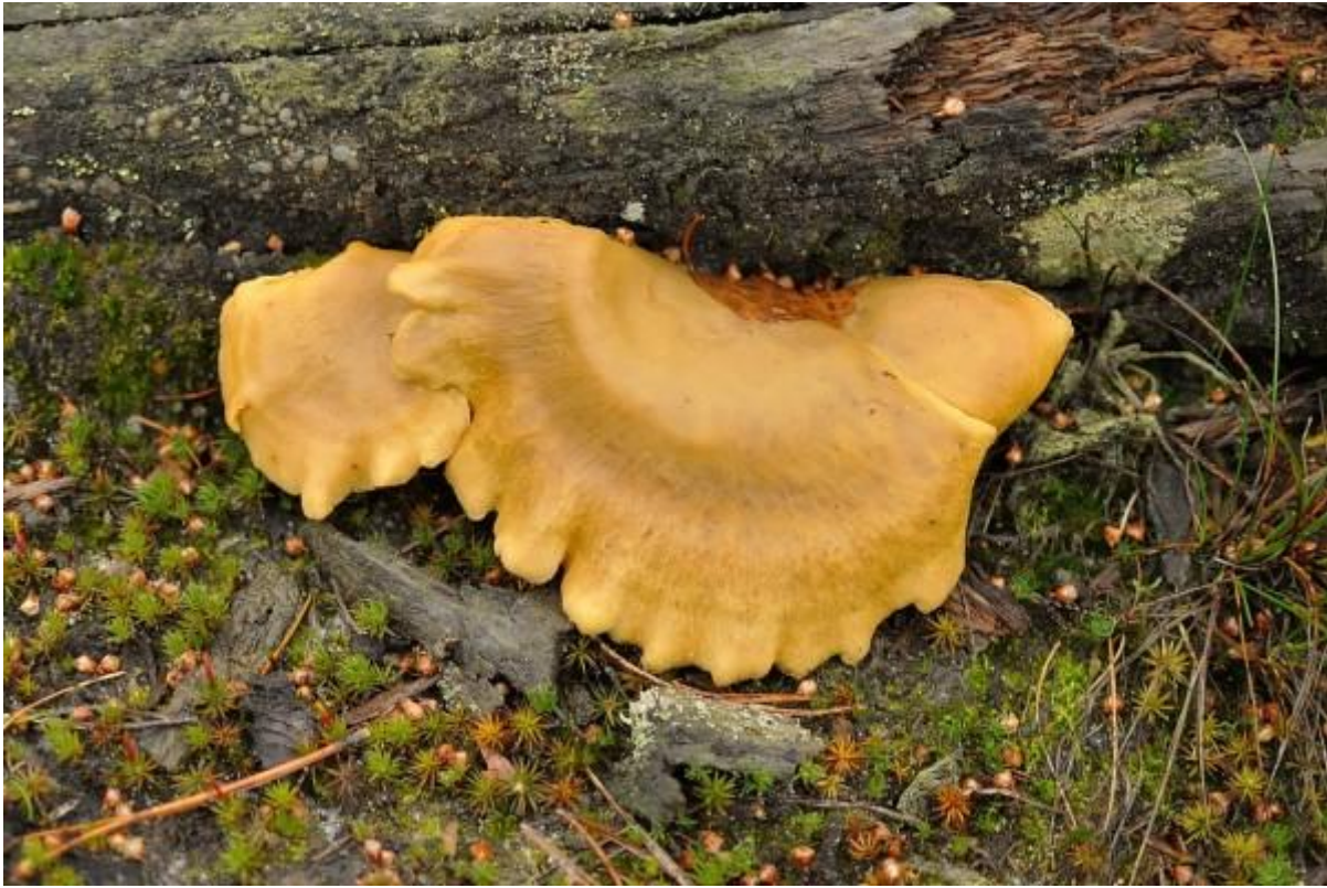
De ongesteelde krulzoom