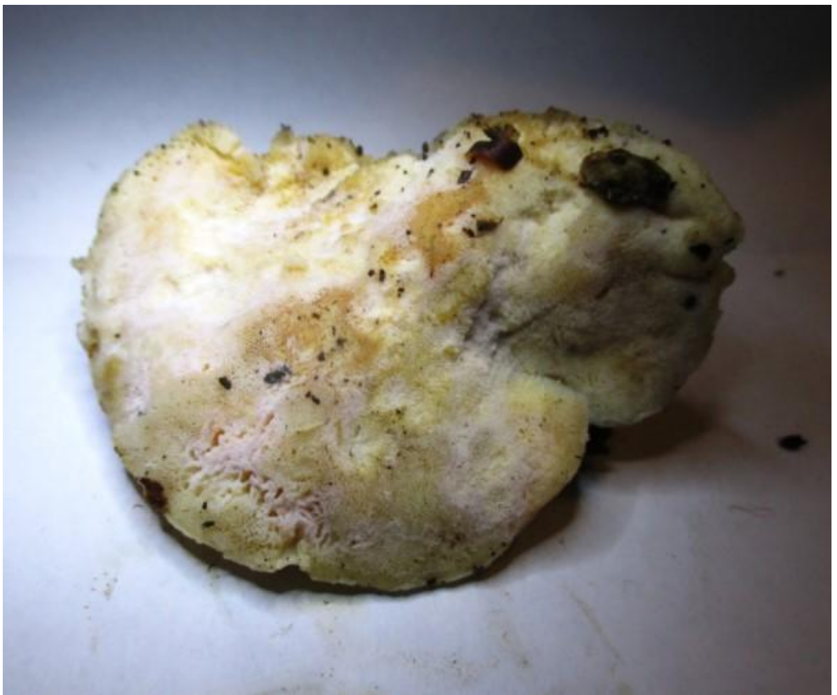
Een vlekken kaaszwam