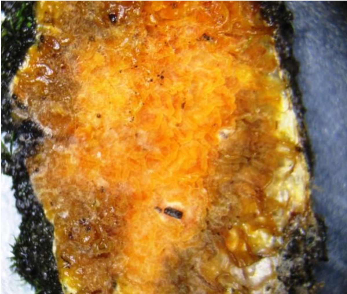
De dakloze huiszwam