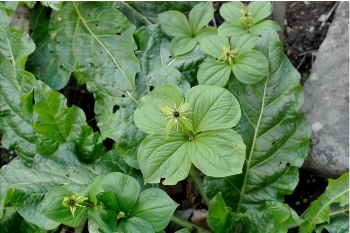
De klassiekers van Elsloo eenbes en reuzepaardenstaart