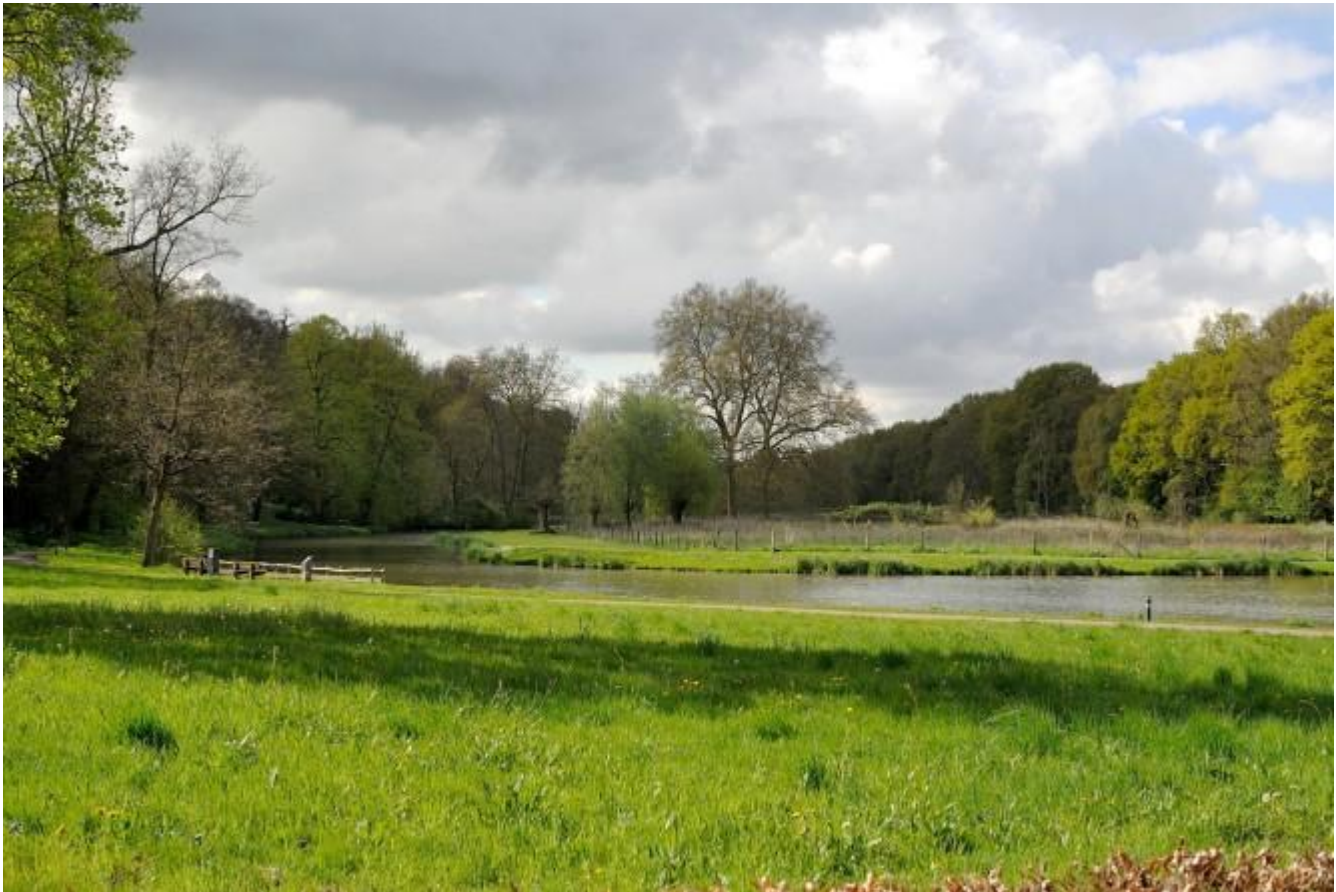
Een vertrouwd beeld voor de plantenliefhebber