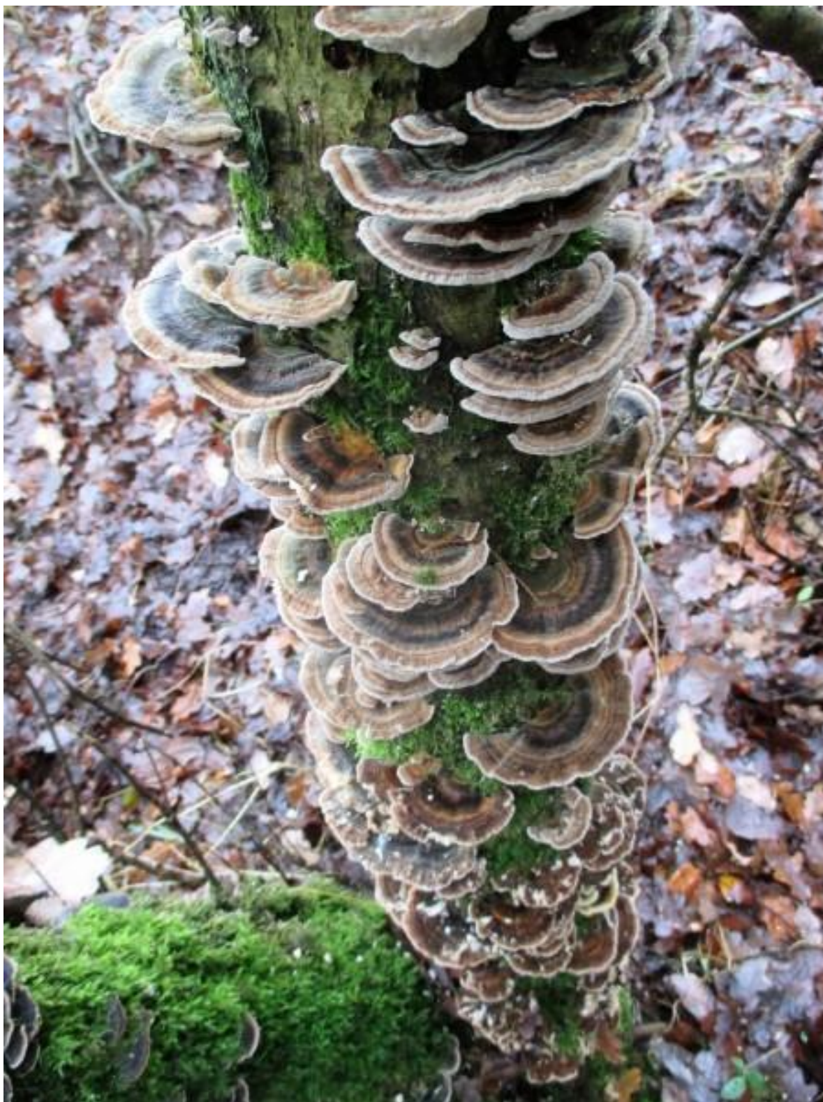
Het gewoon elfenbankje