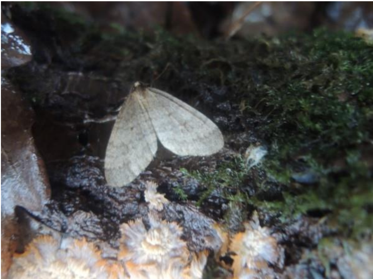
Een kleine wintervlinder