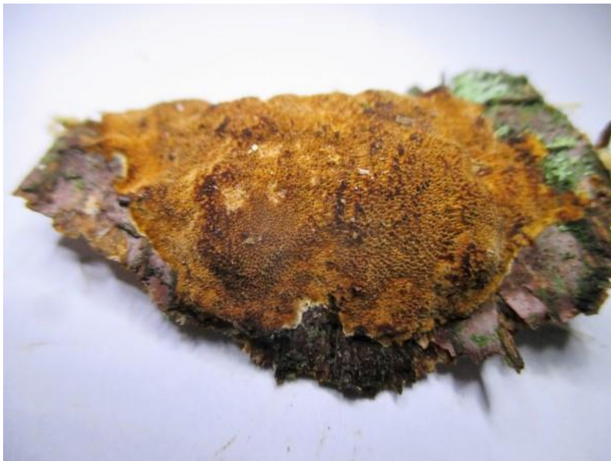
De gewone vuurkorstzwam