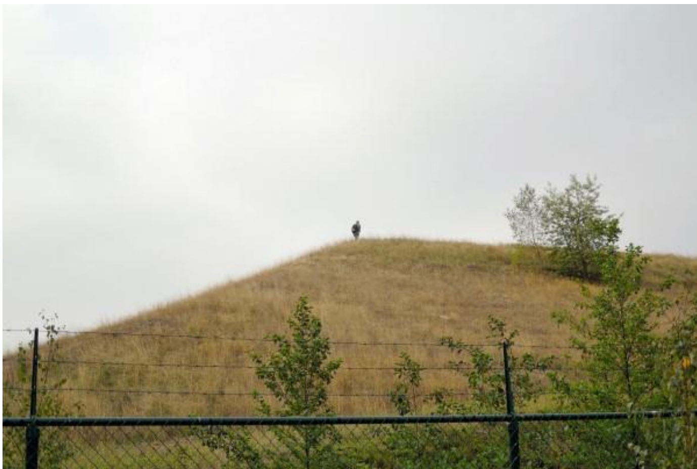
Een onverschrokken klimmer