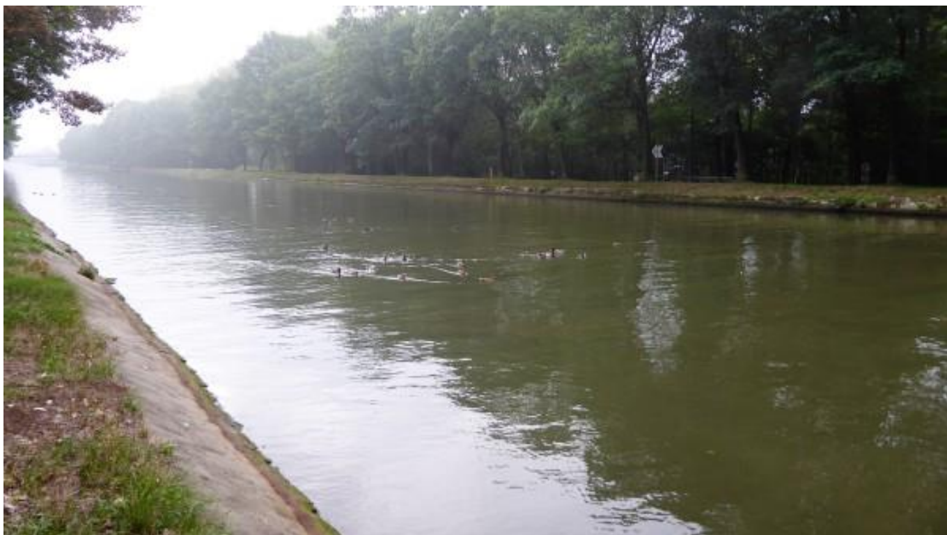
En een idyllisch beeld van eendjes op het kanaal om de nieuwsbrief af te sluiten