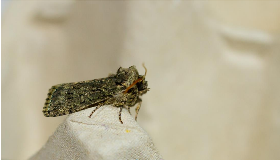
Figuur 1: Groenige orvlinder (PC)